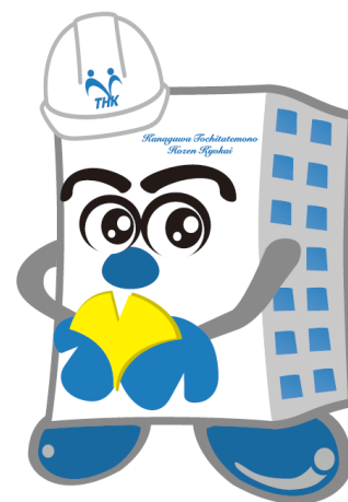
マスコットキャラクター ほぜんくん