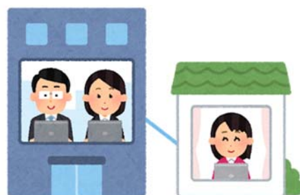
テレワークの導入