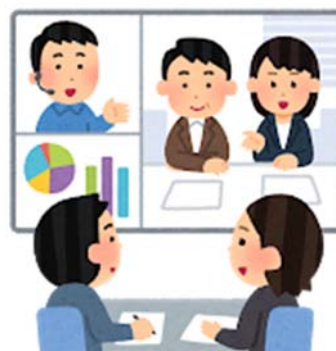
オンラインの推進